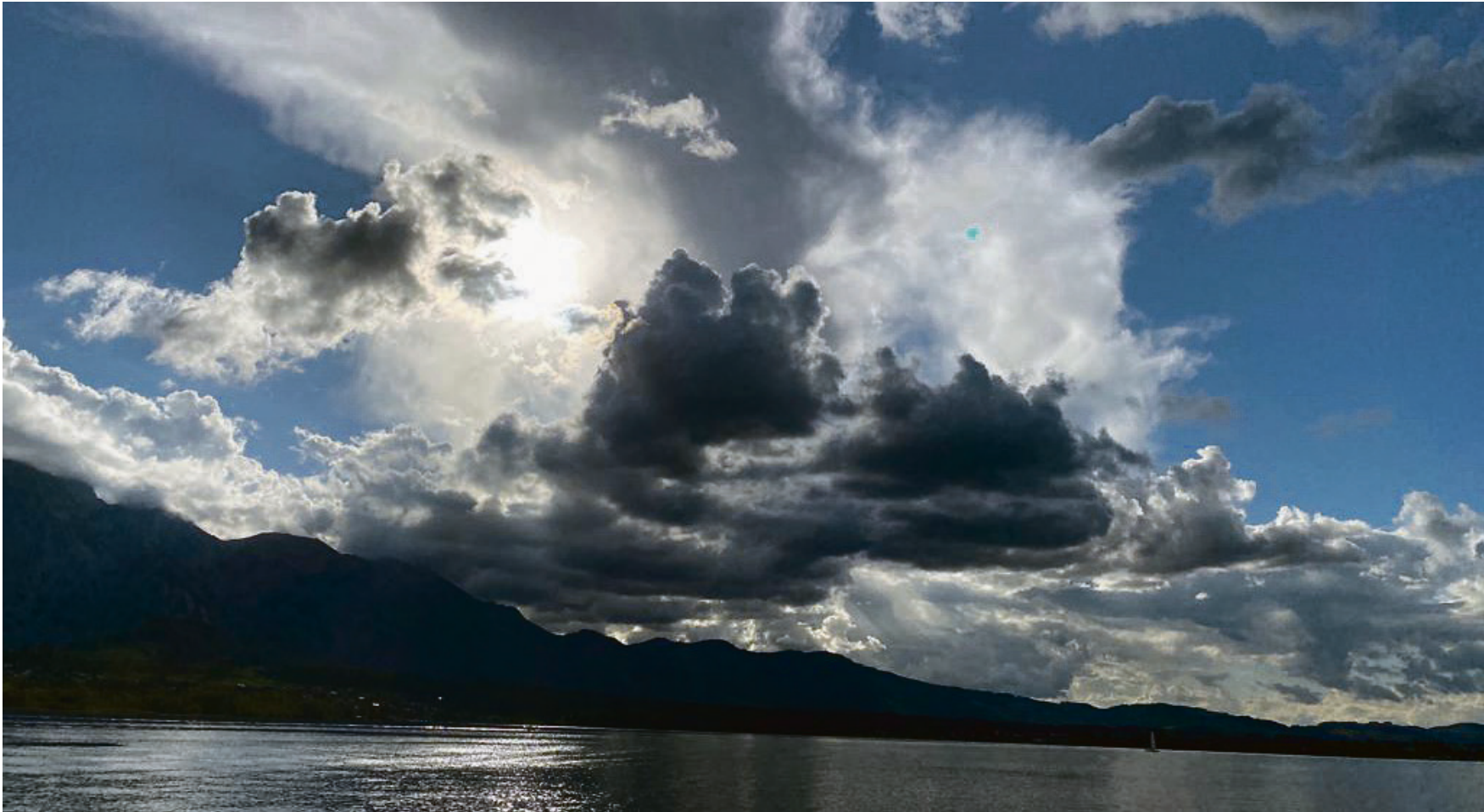
Für viele ist die Coronazeit vorbei, mit allem, was dazu gehörte – andere leiden noch lange darunter, nicht allein körperlich, die seelischen Wunden sind tief.