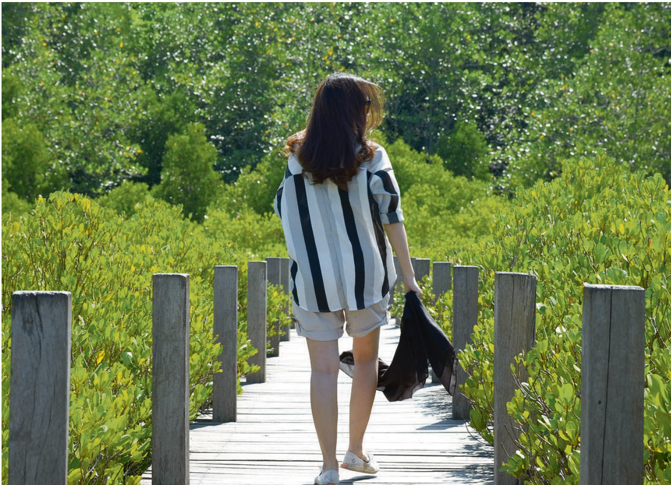
Impfpfopfer trauen sich kaum an die Öffentlichkeit, werden nicht ernst genommen und ihre Impffolgen nicht selten mit Psychopharmaka abgetan.